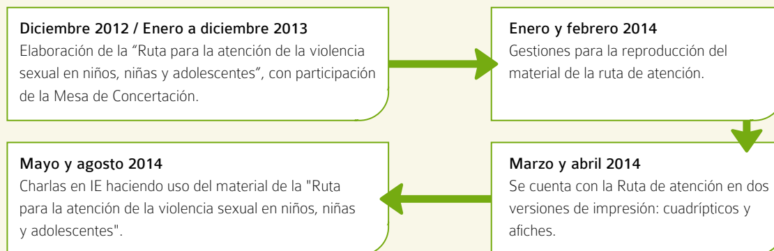
Figura 2. Línea del tiempo de la “Ruta para la atención de la violencia sexual en niños, niñas y adolescentes” y su difusión en las IE