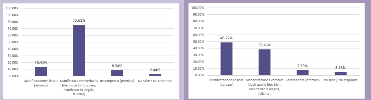
CUADRO 11: CONTRASTACIÓN RESULTADOS CUALITATIVOS: LÍNEA DE BASE / EVALUACIÓN FINAL

Porcentaje de madres y padres de familia que consideran el vínculo afectivo como importante dentro de la crianza.