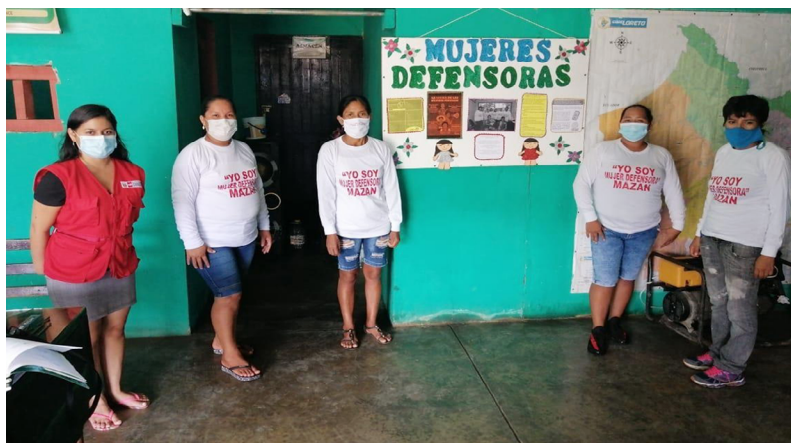
FIGURA 6.1. DIFUSIÓN DE PANELES INFORMATIVOS EN LAS INSTALACIONES DE LA PNP DEL DISTRITO