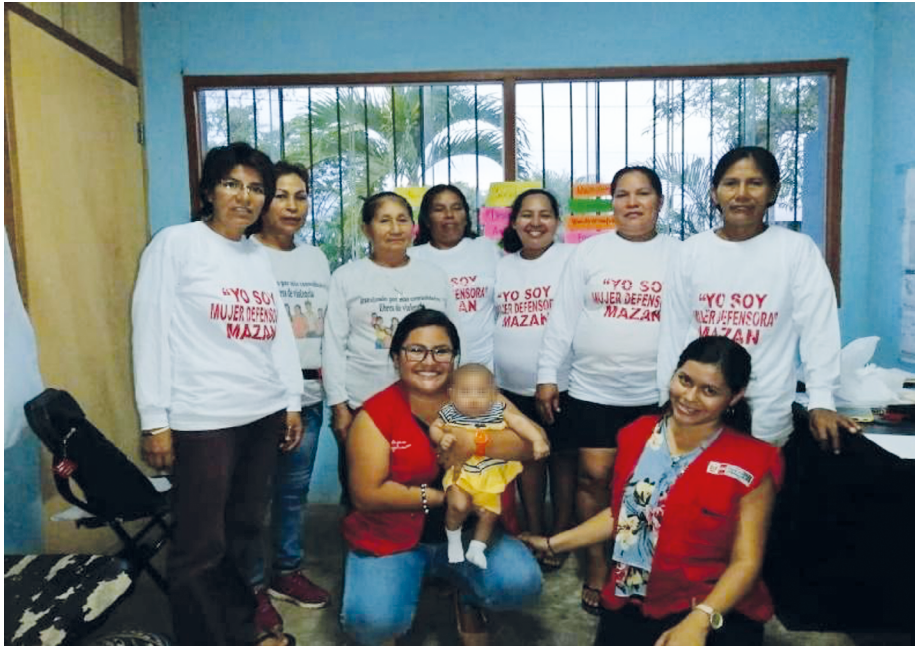
FIGURA 6.5. MUJERES DEFENSORAS