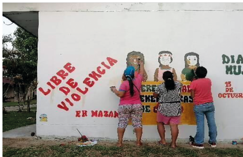
FIGURA 6.3. MURAL PARA FORTALECER EL ROL DE LA MUJER RURAL