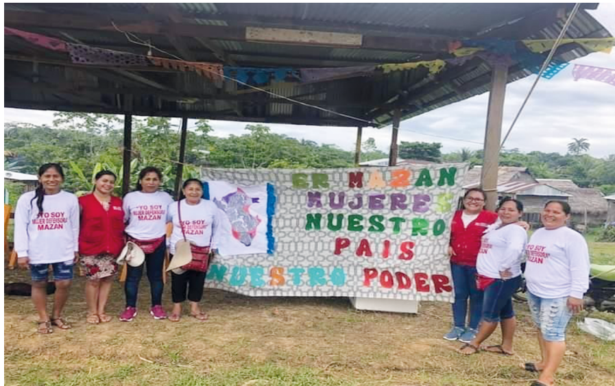
FIGURA 6.6. SENSIBILIZACIÓN A LA POBLACIÓN GENERAL PARA LA PREVENCIÓN DE LA VIOLENCIA