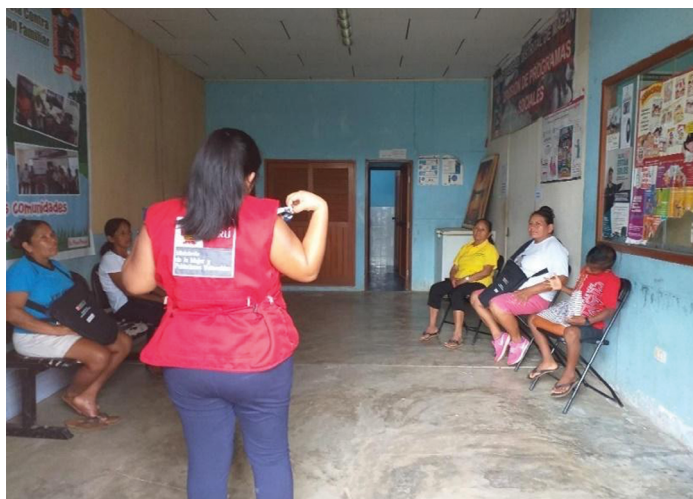
FIGURA 6.4. FORTALECIMIENTO A MUJERES DEFENSORAS

La experiencia «Mujeres defensoras» se convierte en la posibilidad de contar con actoras de cambio sostenibles en el tiempo. La experiencia nos ha mostrado la participación relevante que tienen sus familias y se convierte en una red de apoyo para la permanencia de su rol en la comunidad. Finalmente, esta experiencia nos permite soñar con un trabajo preventivo que promueva el buen vivir desde la integración y la acción conjunta, por lo cual es necesario promover más espacios de fortalecimiento y mayor reconocimiento al trabajo voluntario que realizan las defensoras.