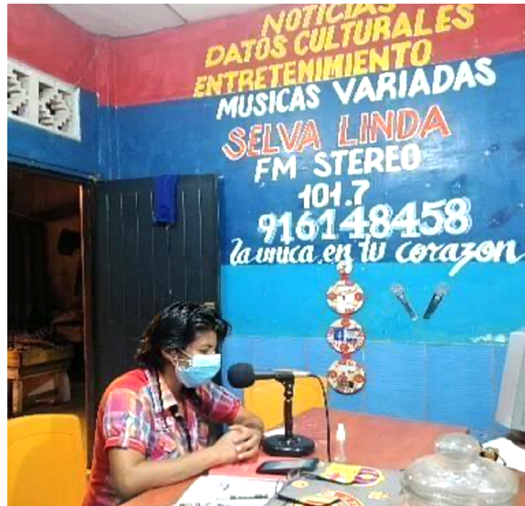
FIGURA 6.2. DIFUSIÓN DE AUDIOS «RELATOS PARA EL BUEN VIVIR»